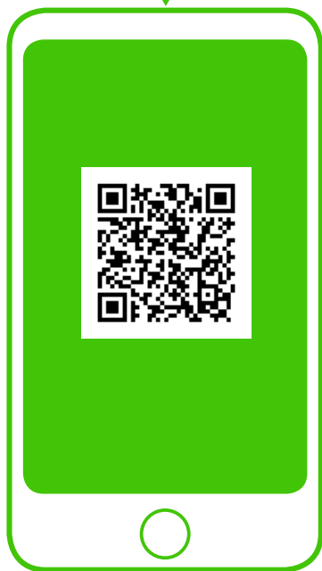
※新型コロナ対策パーソナルサポート（行政） QRコードから登録